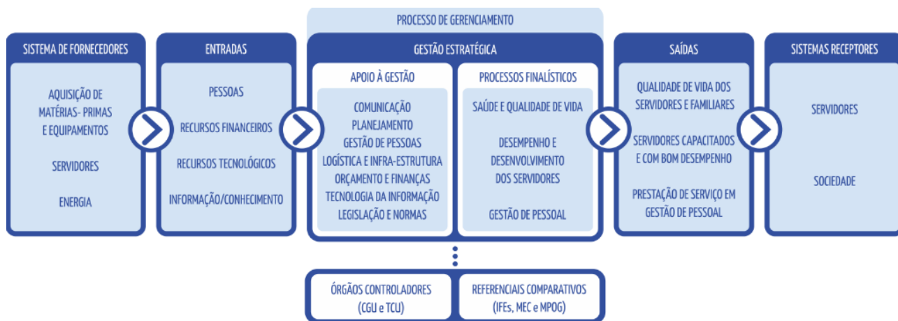
Figura 1 - Cadeia de Valor da PROGEP